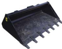
nakladacia lyžica 0cm