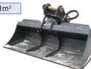
svahovacia vykývna 2m