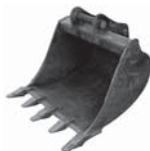
lyžica 1m 3